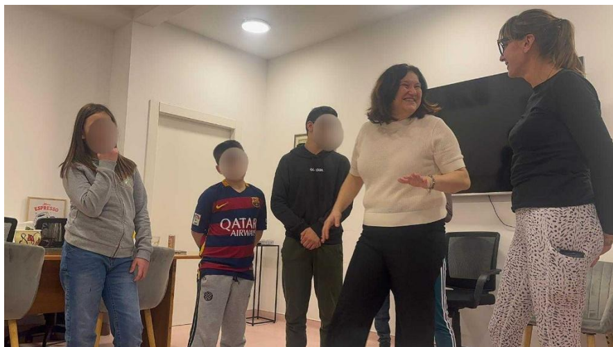
Slika 5 Radionica Komunikacijskih i prezentacijskih vještina u Splitu