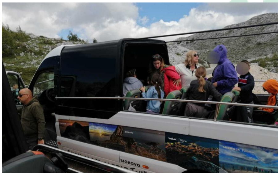
Slika 6 Poludnevni izlet na Biokovo