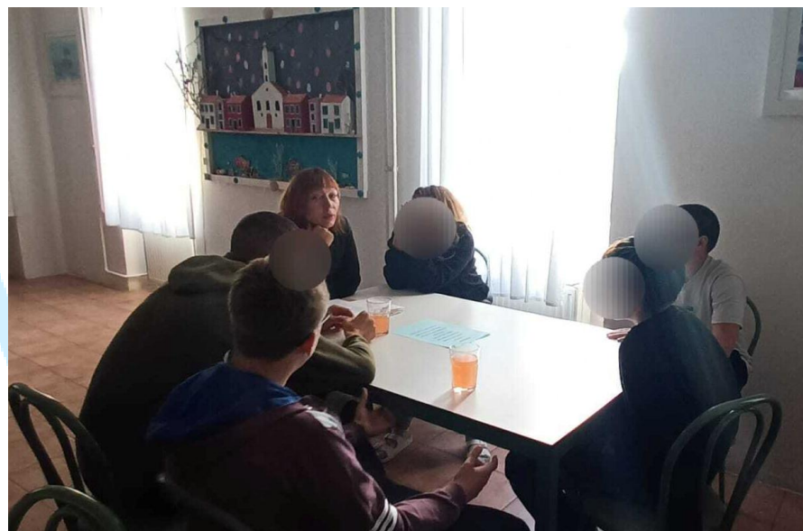
Slika 3 Radionica Socijalnih vještina u Kaštel Lukšiću