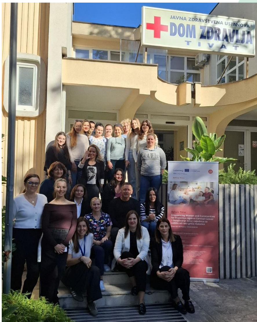
Slika 10 Projektni sastanak projektnog tima Before Time u Tivatu, Crna Gora

U 2025. godini u sklopu projekta Before Time provedeno je i kreirano: