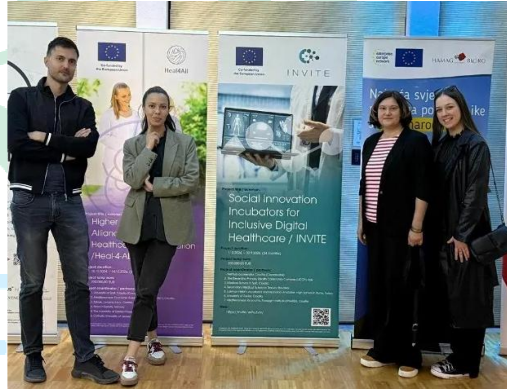
Slika 13 Promocija INVITE projekta na HealthTech Adria Conference 2025 na Medicinskom fakultetu u Splitu

Opremanjem strukovnih škola naprednim digitalnim alatima, inovativnim kurikulumom i snažnim fokusom na društveni utjecaj, projekt ima za cilj pripremiti studente i nastavnike za razvojne zahtjeve digitalne zdravstvene skrbi.