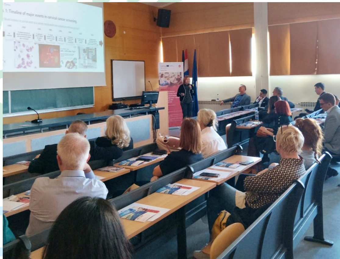
Slika 9 Presentacija Before Time projekta na skupu "Od prevencije do terapije: HPV i rak te druge posljedice HPV infekcije" na Sveučilištu u Zadru

Kroz projekt se provode različite aktivnosti, uključujući edukativne kampanje za podizanje svijesti o važnosti redovnih pregleda i HPV testiranja, informiranje i savjetovanje žena o preventivnim mjerama, te pružanje podrške u pristupu zdravstvenim uslugama.