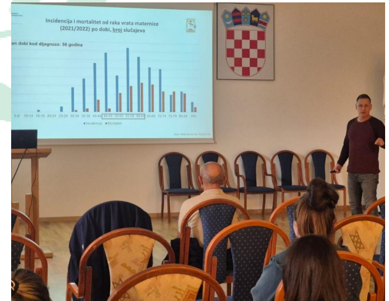
Slika 12 Edukativni susret posvećen razumijevanju epidemiologije, kliničke slike i prevencije infekcija HPV-om u Psihijatrijskoj bolnici Ugljan