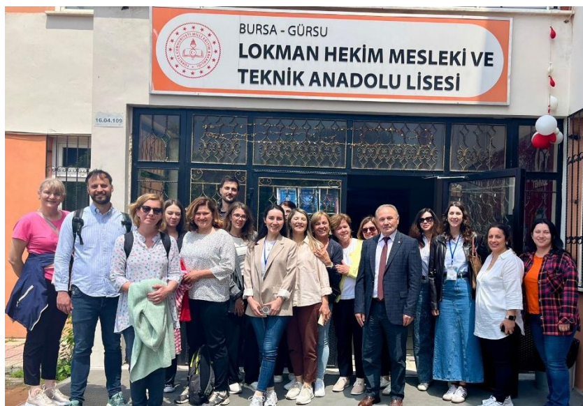
Slika 14 Druga kratka obuka (Second short staff training) u Bursi, Turska