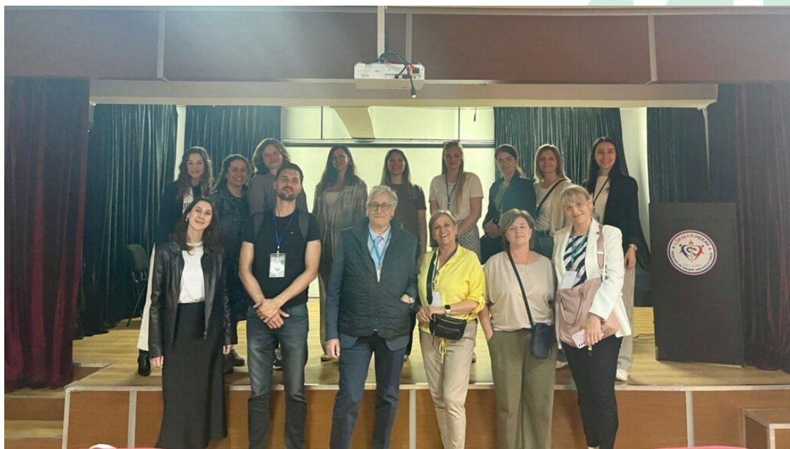
Slika 15 Druga kratka obuka (Second short staff training) u Bursi, Turska

U sklopu projekta INVITE, u 2025. godini je provedeno i kreirana: