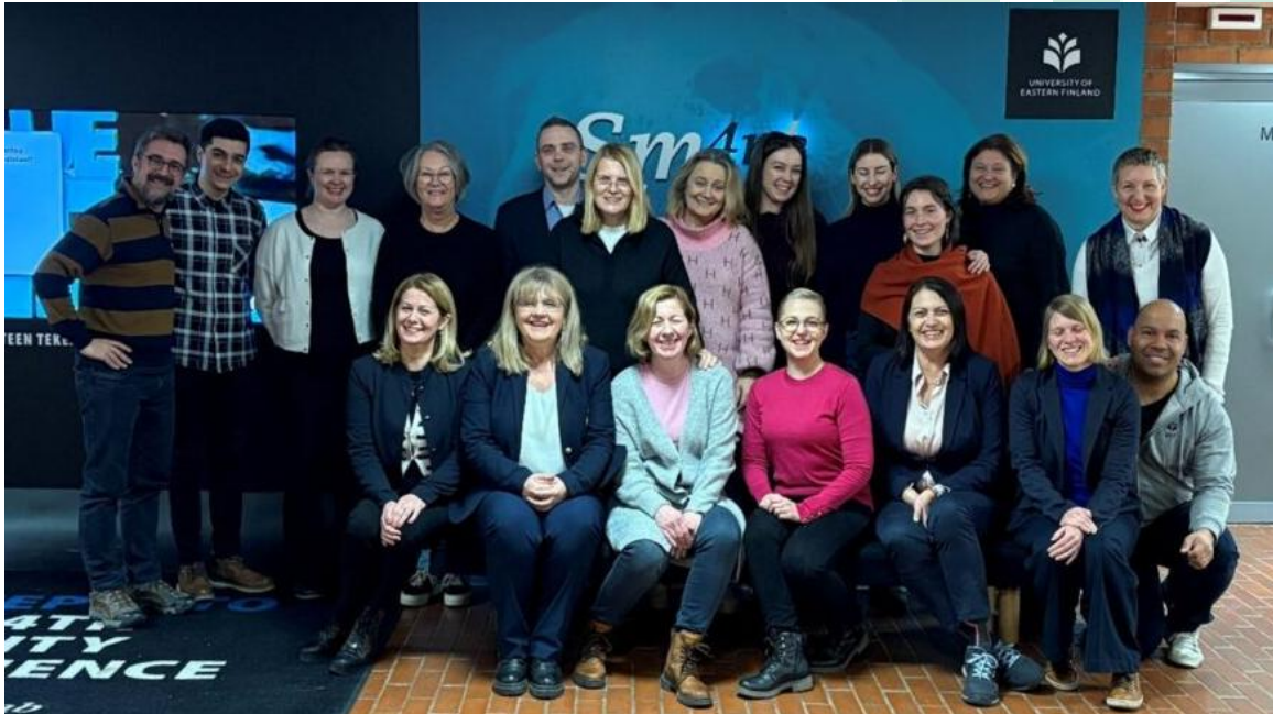
Slika 16 Druga kratka edukacija osoblja o dizajnu i izradi video i drugih sadržaja (Second short staff training on the design and delivery of engaging video and other content) u Joensuu, Finska

Projekt HEAL4ALL - Savez visokih učilišta za inovativnu zdravstvenu skrb i obrazovanje