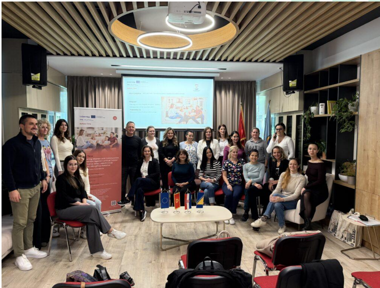
Slika 11 Projektni sastanak projektnog tima Before Time u Tivatu, Crna Gora