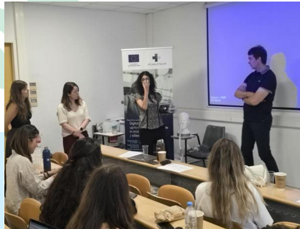
Slika 7 Ekspedicija učenja (Learning Expedition) na Kreti, Grčka

Projektne partneri zajednički su osmislili, pilotirali, evaluirali i diseminirali inovativne programe osposobljavanja u visokom obrazovanju u području uključive digitalne zdravstvene skrbi, s posebnim naglaskom na digitalna rješenja u medicini spavanja za prevenciju, dijagnostiku i terapiju.