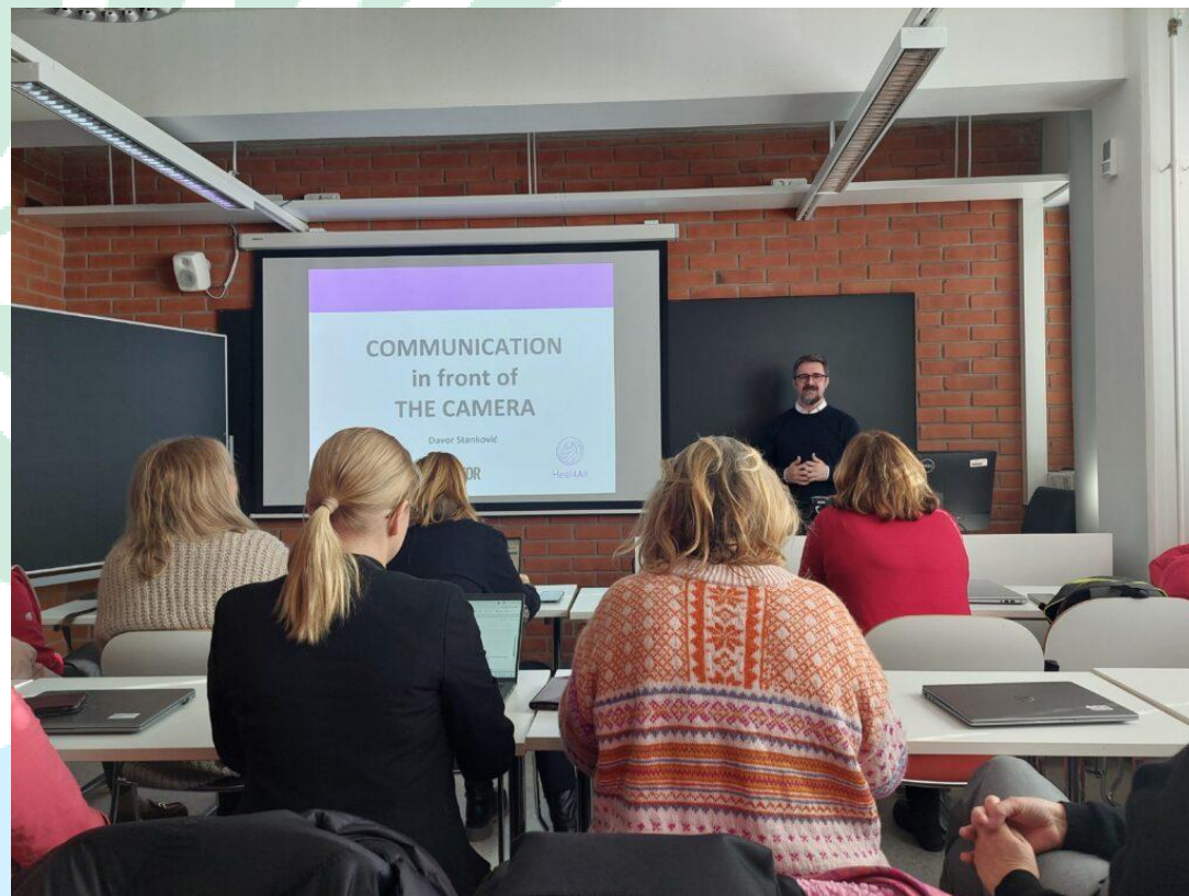
Slika 17 Druga kratka edukacija osoblja (Second short staff training) – medijska obuka u Joensuu, Finska