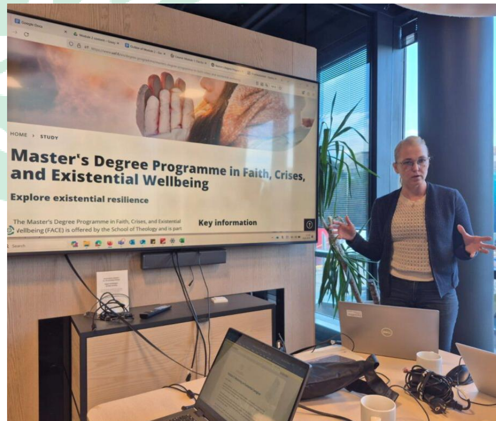
Slika 19 Projektni sastanak na Sveučilište Nord u Bodøu, Norveška