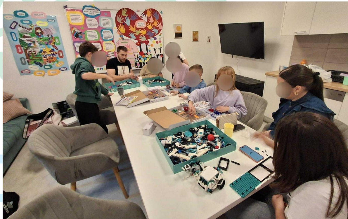
Slika 1 ROBOSTEM radionica u Imotskom

Sudjelovanjem u projektnim događanjima i radionicama korisnici će steći uvid u važnost STEM-a u područjima poput medicinske dijagnostike i robotike, kao i u mogućnosti koje im ta znanja pružaju za osobni razvoj i buduću karijeru.