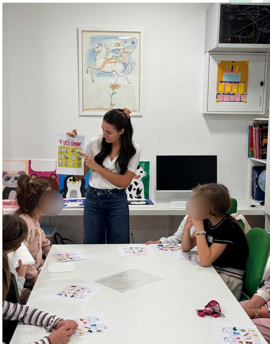
Slika 2 Prirodoslovna STEM radionica u Splitu

U 2025. godini u sklopu programa STEM za bolje sutra održano je: