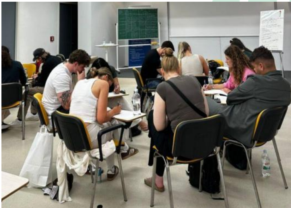
Slika 8 Socijalni inovacijski inkubator (Social Innovation Incubator) u Splitu

U 2025. godini u sklopu projekta eSleep_dHealth, kreirano je i održano: