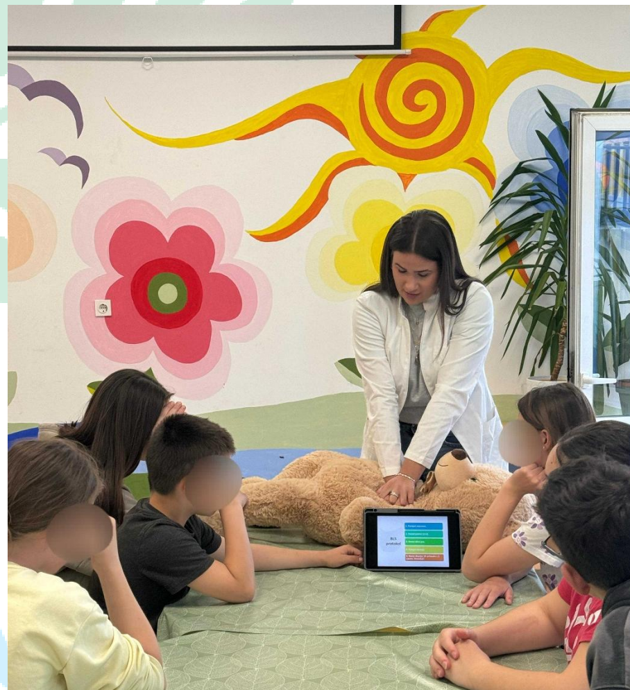
Slika 4 Prirodoslovna STEM radionica u Splitu