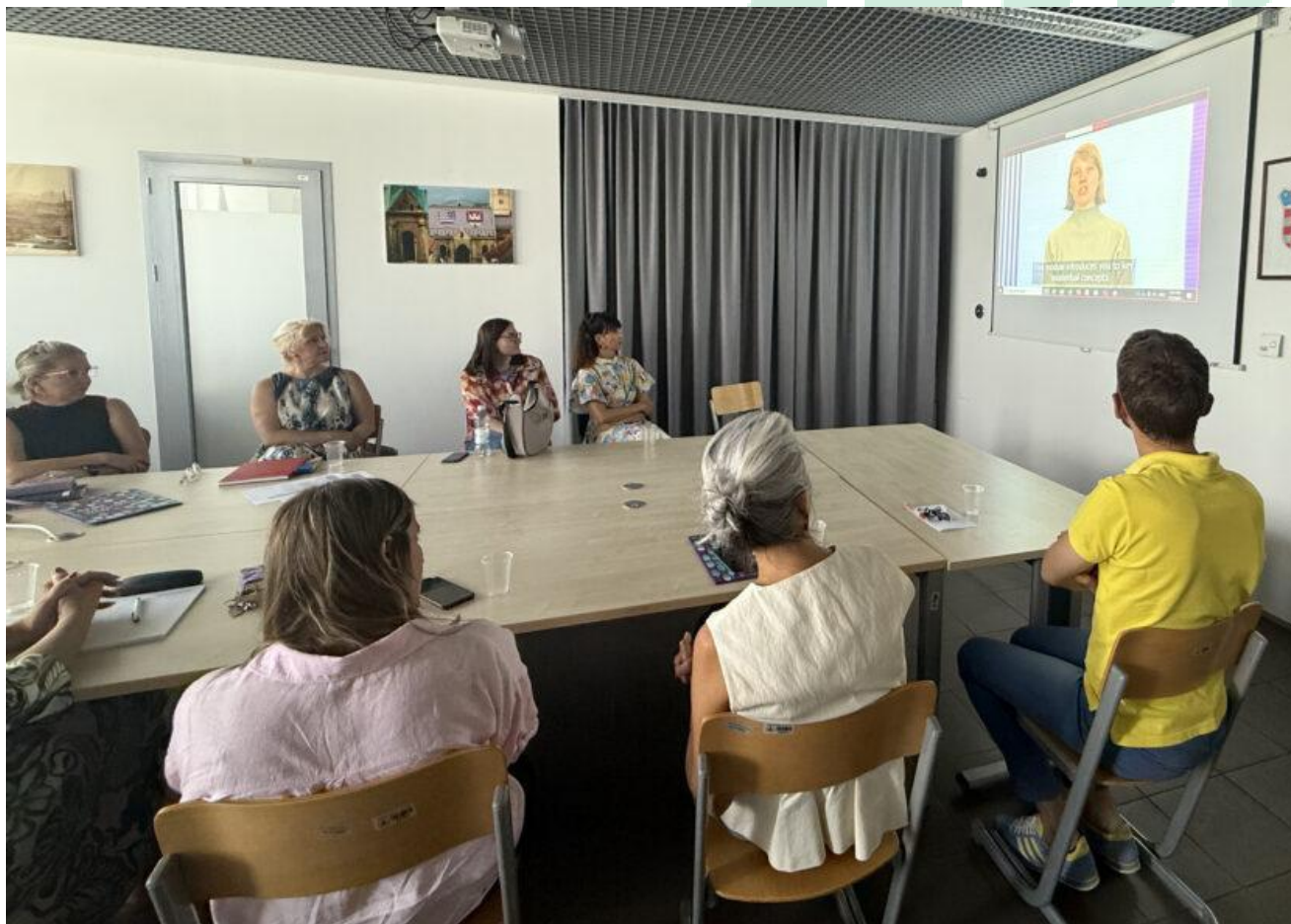
Slika 20 Promoviran projekt HEAL-4-ALL na Radionici za prijenos znanja namijenjena nastavnicima na Sveučilištu u Splitu